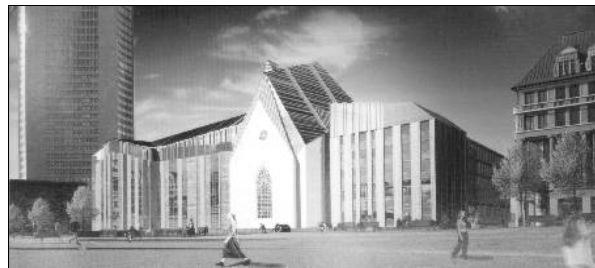
van Egeraat Ausstellung Leipzig 2004