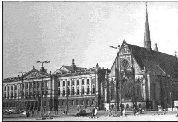
Augusteum und Universitätskirche 1968

Die Vernichtung der Universitätskirche auf Be- treiben der Universität und auf Weisung Ulbrichts und seiner SED löste 1968 eine breite Protestbe- wegung aus, die sich mit der durch die Leipziger Montagsdemonstrationen eingeleiteten Wiederver- einigung Deutschlands vollendete.