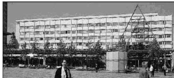
Universitätshauptgebäude 1972 mit Installation Paulinerkirche 1998